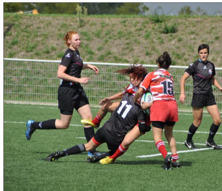
Les Illkirchoises tenteront un peu plus d'asseoir ce samedi leur domination sur la Fédérale féminine à XV.

En recevant Pontarlier, avec qui il partage la tête du championnat, ce samedi (19 h 30) au complexe sportif Schweitzer d'Illkirch-Graffenstaden, le CRIG veut s'imposer pour pointer seul en tête de la poule 4 de Fédérale féminine à XV.