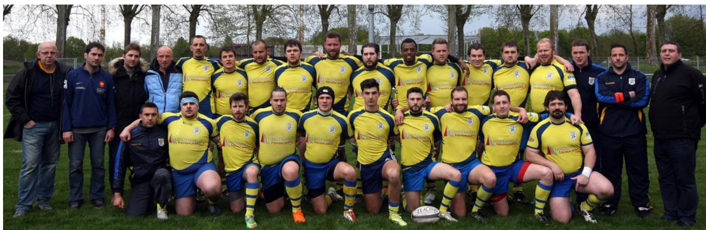
L'équipe des Cheminots qui a acquis la montée de haute lutte au printemps.

Quelle fierté ! Après cinq ans d'existence à peine, l'AS Cheminots Strasbourg vivra dimanche le premier match de son histoire en Honneur. Il sera bien sûr question de maintien, mais avec l'espoir d'exister à ce niveau.